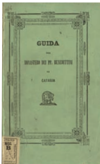
FIG. II. 3a. Guida del monastero dei PP. Benedettini, pubblicata da Francesco Bertucci di Paola nel 1846.

Pochi documenti ci permettono di ricostruire l'aspetto originario del museo benedettino di Catania e la consistenza delle sue collezioni. La descrizione fattane da Francesco Bertucci di Paola nel 1846 (figg. II 3a-b.) rimane per noi un documento fondamentale 14 . A essa si affiancano i Ver-