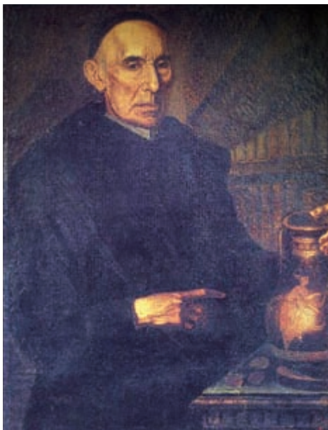
Fig. II. 2. Ritratto di Placido Maria Scammacca. Olio su tela, XVIII secolo. Catania, Museo Civico di Castello Ursino.